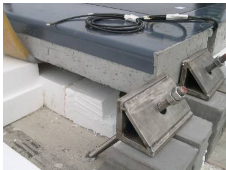
Bild 4: iRoof-Oberschale auf druckfester Dämmung mit Hangabtriebssicherung , BVH Oberhausen