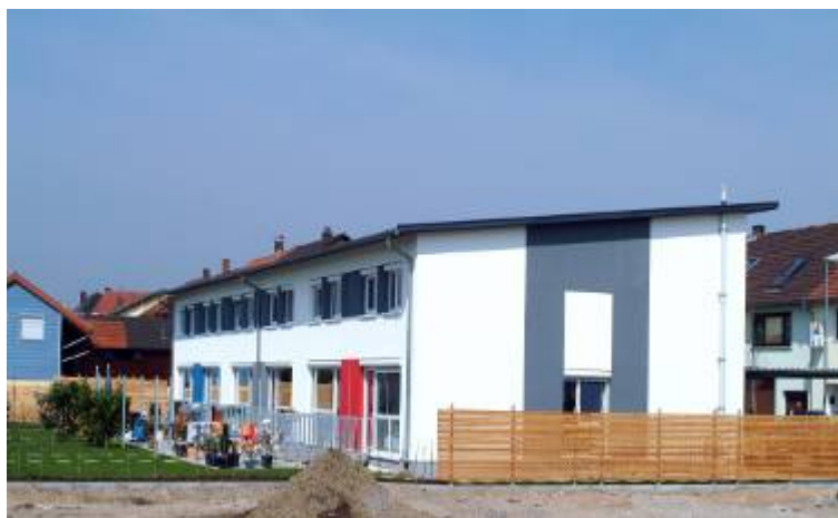
Bild 7: Süd-Westansicht, BVH Oberhausen